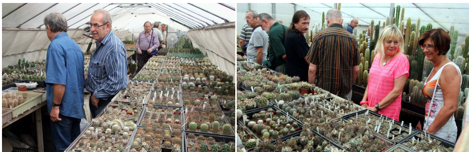
Popis obrázků ze zájezdu na předposlední stránce dole (s. 63)