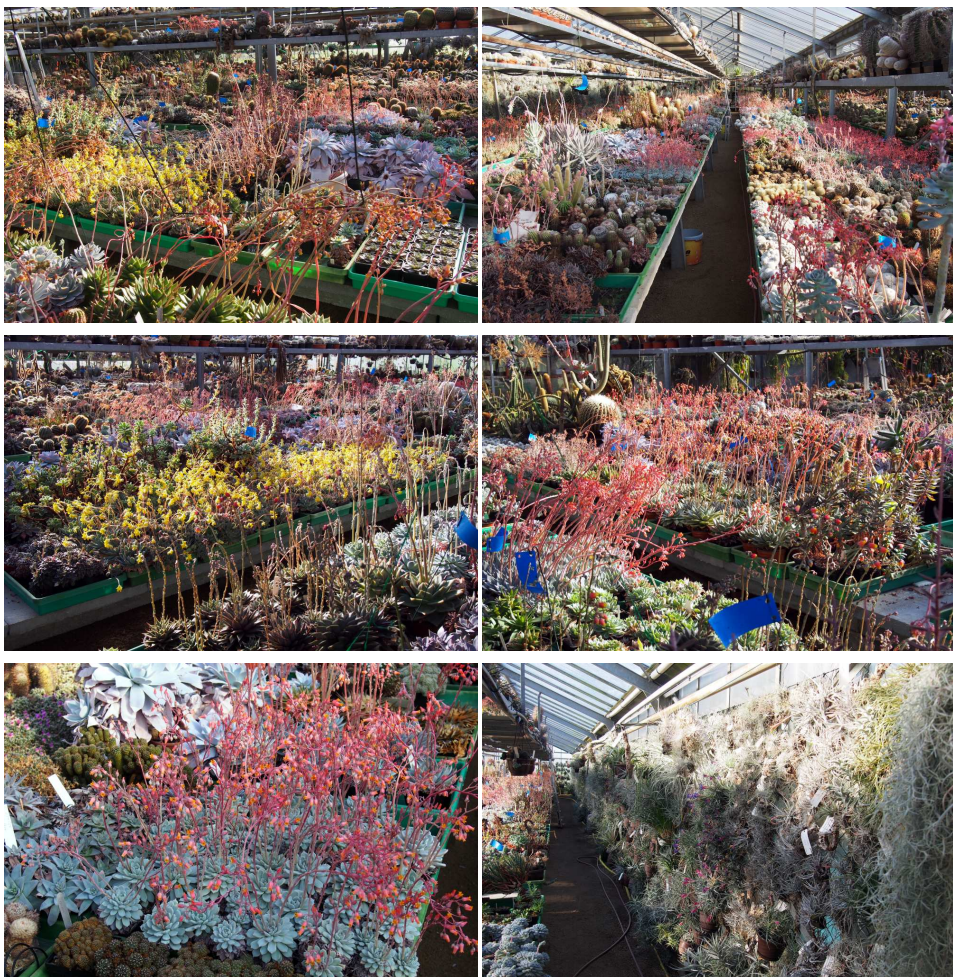
Fotografie Stanislava Stuchlíka k jeho článku na s. 60