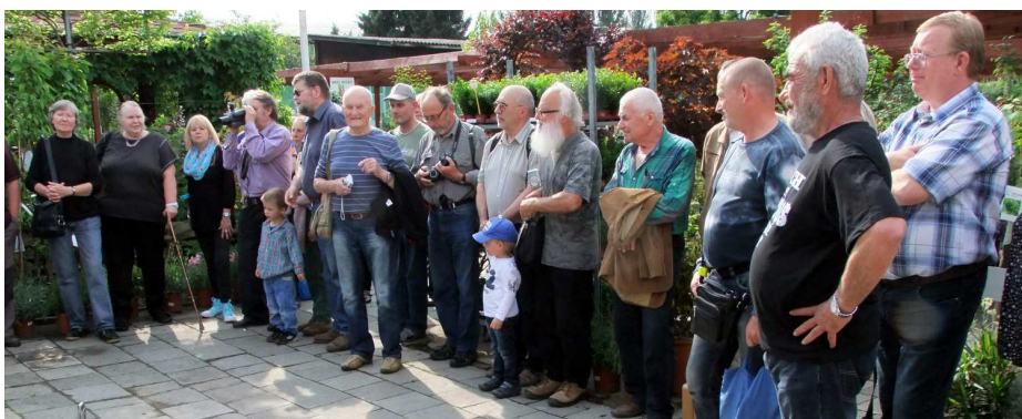
Ze zahájení naší výstavy kaktusů 29. června 2015

Azet – zpravodaj Klubu kaktusářů Astrophytum Brno – Neprodejně – Redakce, jazyková úprava, sazba: Josef Polách – sazba systémem \text{\TeX} s použitím písma Lido – tisk: Tiskárna Indra – vytvořeno s použitím legálního a svobodného softwaru – aniž bylo vědomě ublíženo živým tvorům – v článcích byly opraveny jazykové a typografické chyby, beze změny smyslu sdělení, není-li uvedeno u příspěvku jinak – připomínky, náměty, příspěvky prosím na adresu josef@polach.org