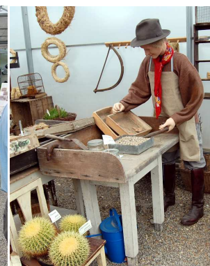
...autor článku chystající se přesazovat