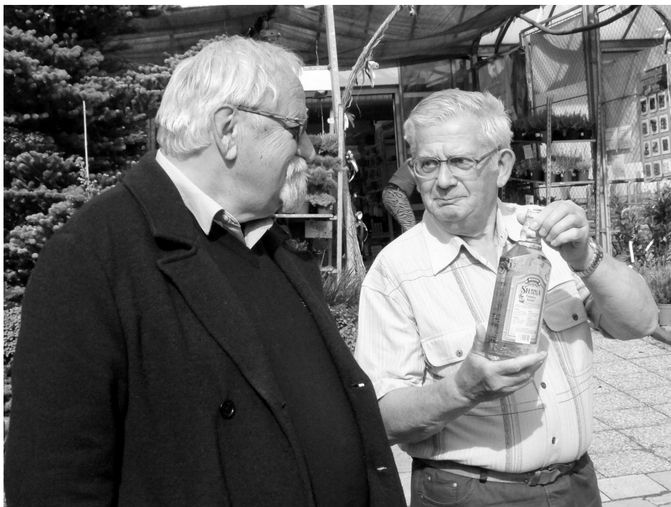
Vedoucí Čtyřlístku a předseda Astrophyta při zahájení výstavy

I letos vyvrcholila klubová sezóna tradiční výstavou kaktusů. Jako v předchozích letech se konala v Zahradním centru Čtyřlístek v Brně-Bystřci. Výstava byla provedena v podobném duchu a stylu jako ta loňská „jubilejní“. Proběhla ve dnech 30. května až 7. června 2015.