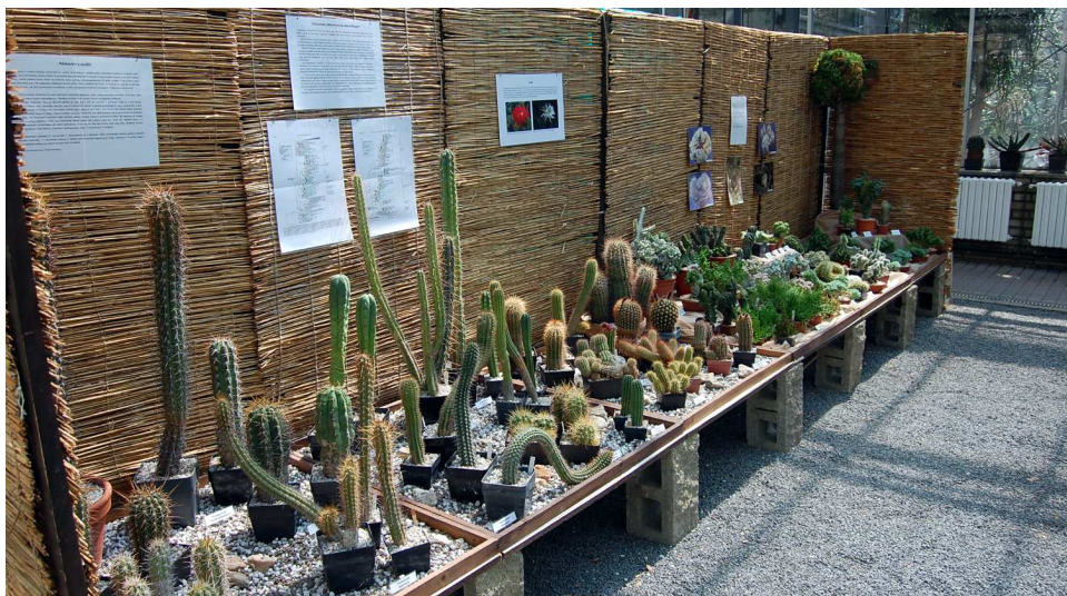
Na výstavě v botanické zahradě...