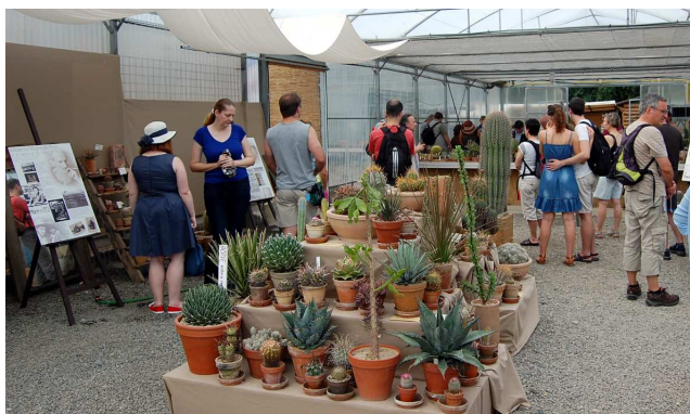
Centrální parapet a ...