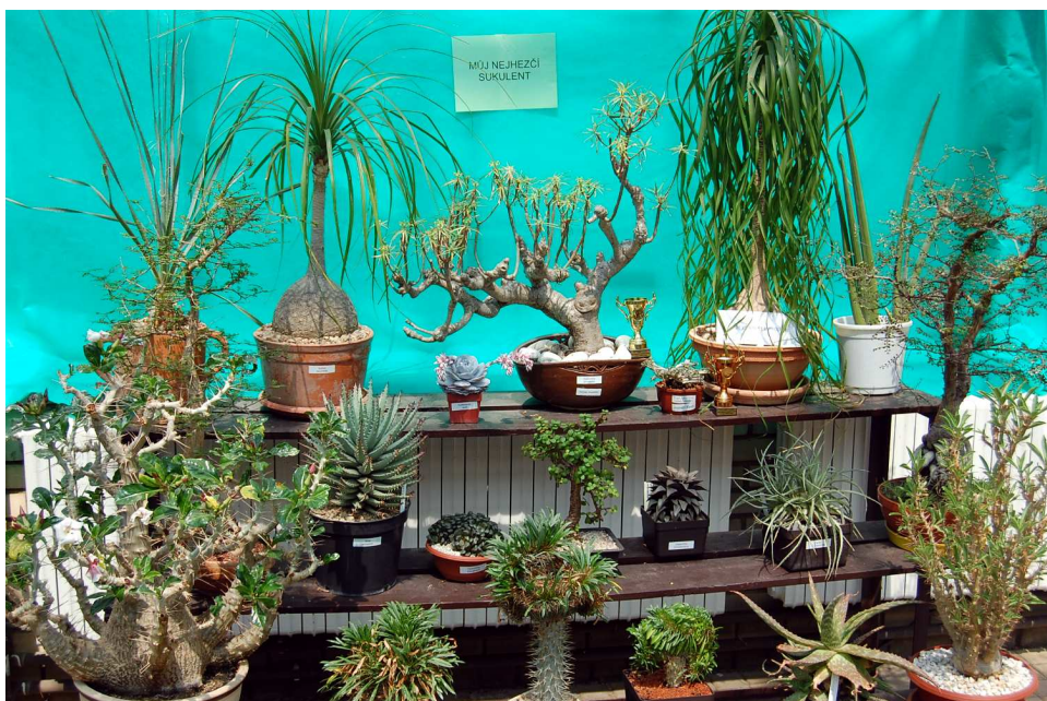
...si přišli na své i sukulentáři