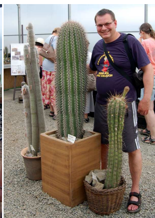
Autor článku a Carnegiea gigantea