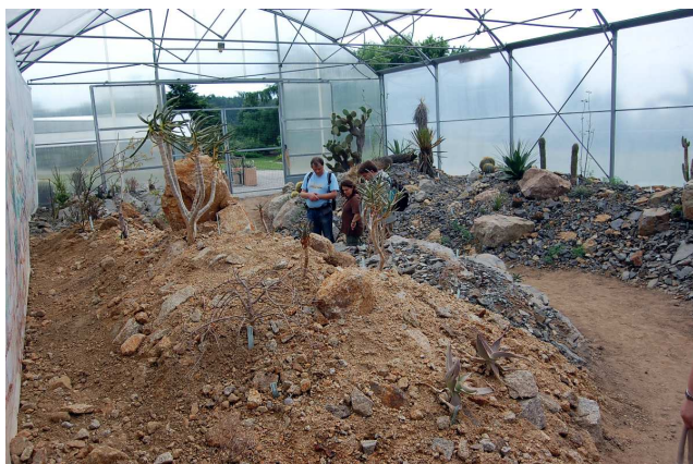
Představa sukulentní krajiny