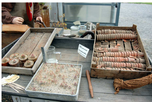
Květináče a rostliny připravené k přesazování