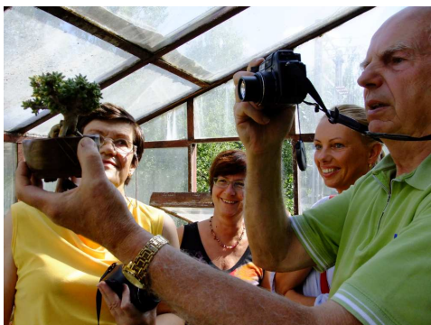
Návštěva v Pávově