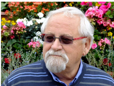
Šéfové při zahájení výstavy ve Čtyřlístku