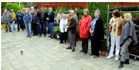
Příprava a zahájení výstavy ve Čtyřlístku