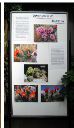
Z výstavy sukulentů v Brně