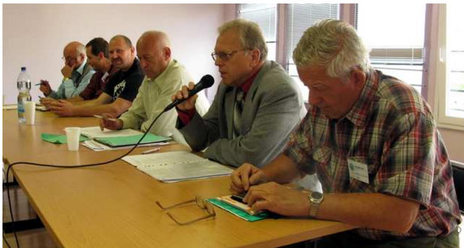
Z valné hromady: Odstupující výbor Společnosti