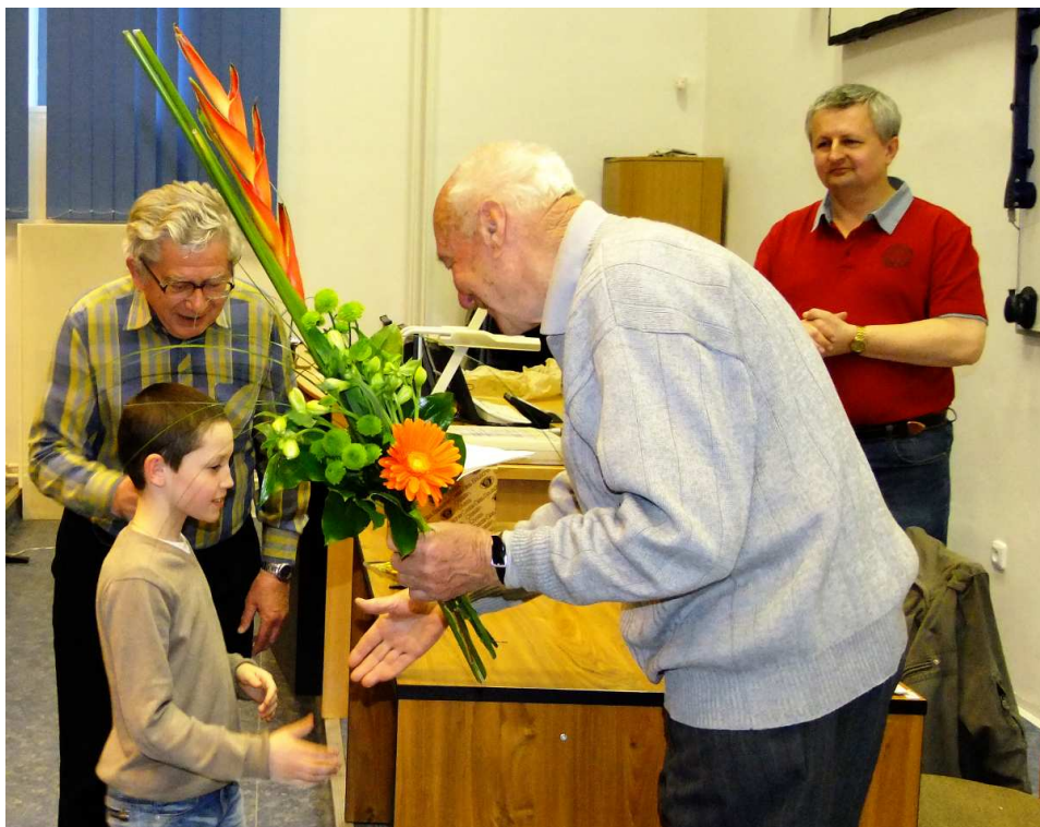
Předseda, nejmladší člen, přednášející/oslavenec a moderátor dubnové přednášky