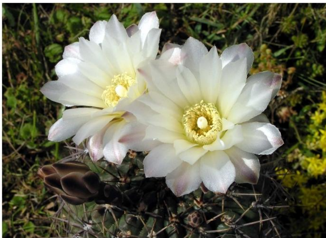
Gymnocalycium gibbosum (ilustrační foto)